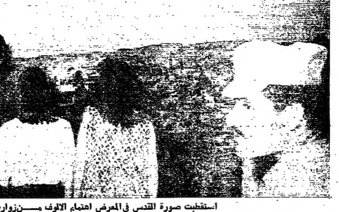
استقطبت صورة القدس في المعرض اهتمام الآلاف من زواره